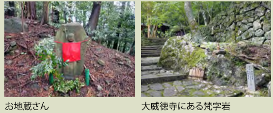
お地藏さん 大威徳寺にある梵字岩

牛滝からのぼる「地藏さん登山道」は道々に地藏が置かれ、葛城修験道を構成する道です。大威徳寺境内には「これより葛城山へ三十一丁」と刻まれた大きなお地藏様があり、葛城山山頂のブナ林の中に三十一丁地藏があります。 葛城修験の関連道として、犬鳴山からの登山道もあります。