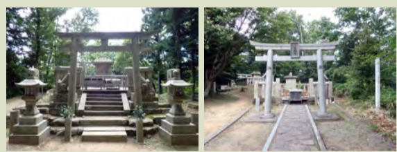
高麗神社 八大龍王社

山頂にある 高麗(たかおかみ)神社は雨乞いの神様として地元の信仰を集めています。葛城山のブナ林は、この神社の社寺林として伐採が禁じられ、保護されてきたと考えられます。 和歌山県側に八大龍王社があり、二つの神社が背を向けて建立されています。